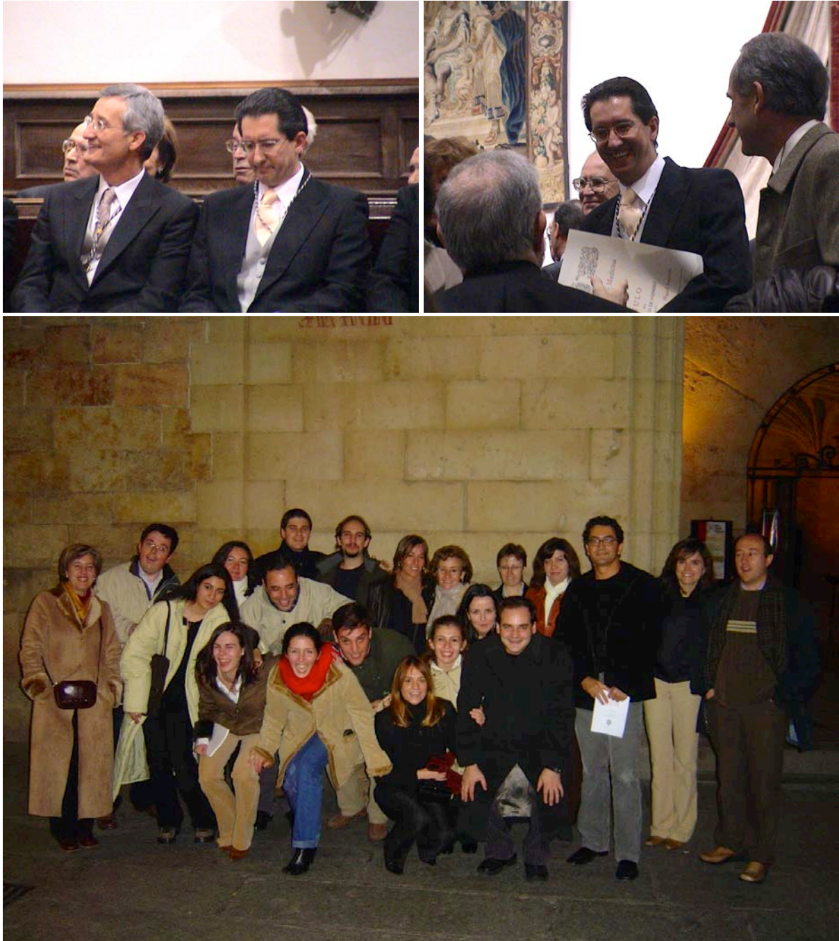
Fotografía alegre de parte del equipo en la puerta del Edificio Histórico de la Universidad de Salamanca